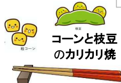
コーンと枝豆のかりかり焼