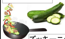
ズッキーニの甘辛炒め