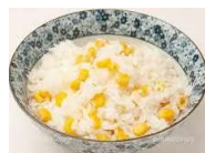
トウモロコシご飯