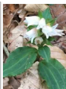
アケボノシュスラン

先月下旬に天生峠から靱糠山(もみぬかやま)へ行ったらエゾリンドウが咲いていました。他にも沢山の花が咲いていたので帰ってから調べるとアケボノシュスラン、トリカブト、シラネセンキュウ、等々でした。山はもうすぐ秋色に染まります。