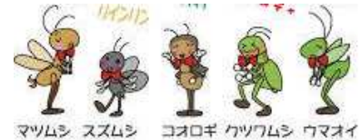
マツムシ スズムシ コオロギ クツウムシ ウマオイ