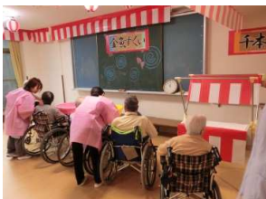
金魚すくいを楽しみました。