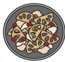
レンコンの しぐれ煮