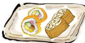
卵巻き寿司 稲荷寿司