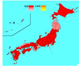
警報マップ1月23日現在